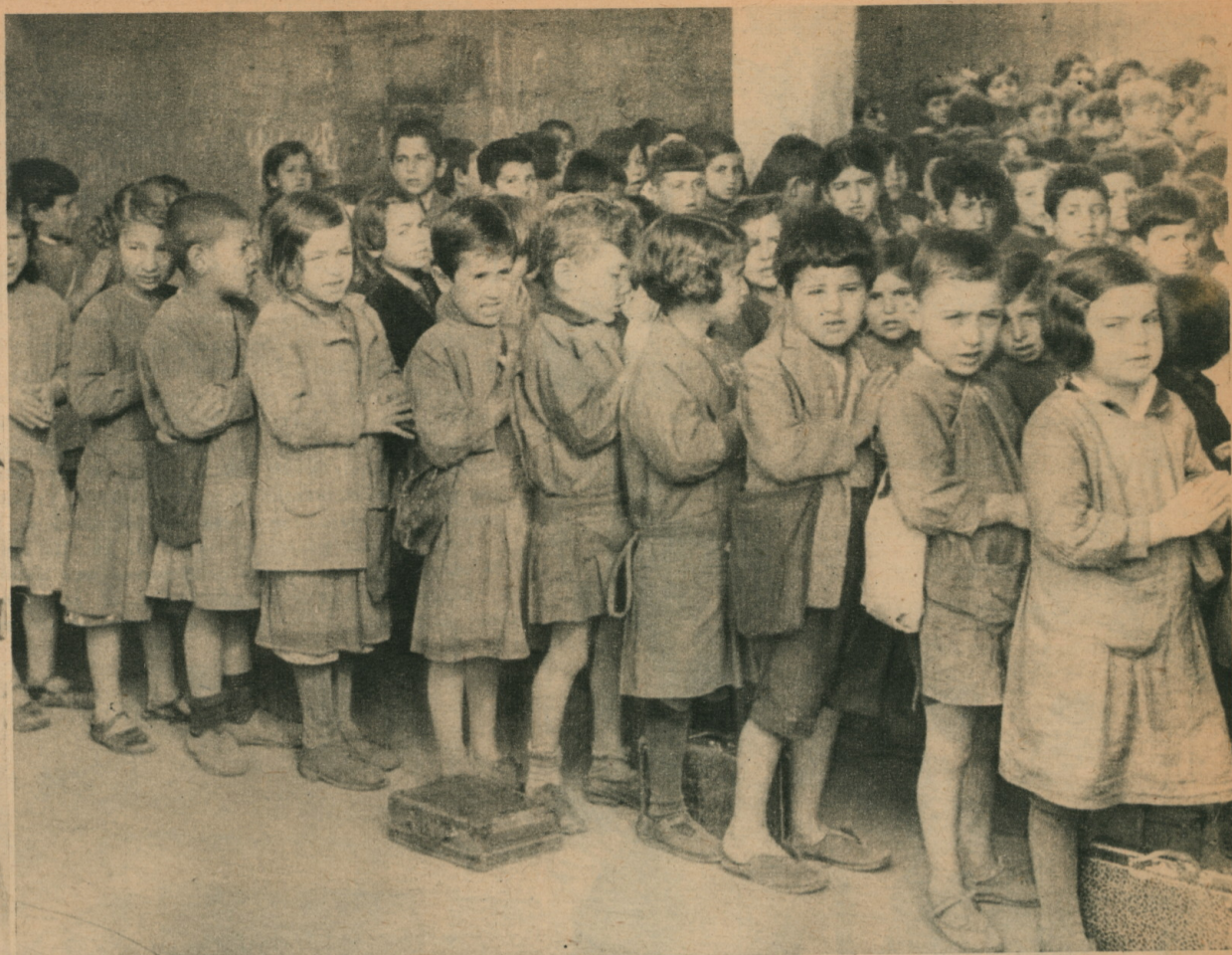
LA PRIERE AVANT LA CLASSE. — Réunis dans la chapelle, les petits écoliers arméniens font la prière quotidienne avant la classe.

plus tard leur domination à l'Arménie, qui perdit sa prospérité économique en même temps que son indépendance. Pourtant l'Arménie avait eu des dynasties qui régnèrent non sans gloire : les Arsachagouniq ou Arsacides avant l'ère chrétienne, les Pakradouniq ou Bagratides qui régnaient encore au temps des Croisades. Un des derniers rois de la Petite Arménie, Léon VI, mourut en France, et fut enseveli à Saint-Denis, à côté des rois de la dynastie capétienne (1393). L'Arménie avait subi une série d'invasions :