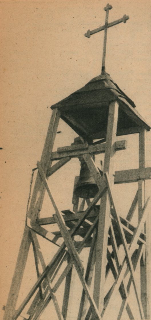
LA CHAPELLE , un baraquement en bois, a son clocher également en bois. Le bâtiment, construit par les femmes et les enfants, sert aussi d'école.