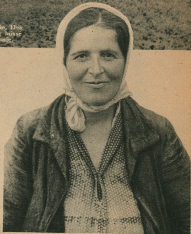
▲ TYPE DE FEMME ARME- NIENNE, aux cheveux et aux yeux noirs. Même condamnée par l'exil à une rude existence, la race con- serve sa beauté.

UN PROVISOIRE QUI S'ETERNISE. — « Mur » d'un baraquement qui abrite depuis trente ans une famille de réfugiés : il est fait de planches, de tôles provenant de vieux bidons, etc.