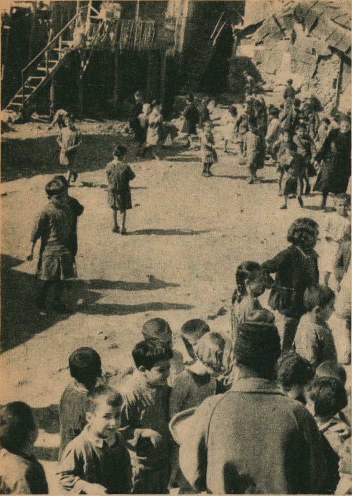
LA SORTIE DE LA CLASSE. — Les écoliers arméniens sont très assidus à l'étude, mais si bien doués qu'ils soient, l'accès des écoles supérieures leur est interdit par le manque de ressources.

traité de Berlin, en 1878, obligea la Turquie à introduire des réformes en faveur des Arméniens, mais cette clause resta lettre morte. Il fallut les massacres de 1895-1896 pour ramener l'attention sur l'Arménie.