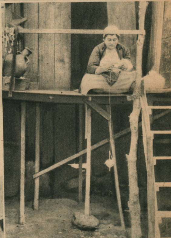
UNE FILEUSE ARMENIENNE. — Au lieu du rouet, cette fileuse emploie le disque des femmes de l'antiquité.

L'Arménie aurait pu espérer plus d'appui de la part des nations chrétiennes : n'a-t-elle pas droit au titre de fille aînée de l'Eglise, puisqu'elle fut le premier Etat qui fit acte d'adhésion publique au christianisme, lors de la conversion de son roi Tiridates par saint Grégoire l'Illuminateur, dès la fin du III e siècle ? Antérieurement déjà, cependant, l'Evangile avait pénétré en Arménie où, selon des traditions plus ou moins mêlées de légende, saint Barthélémy et saint Thaddée auraient exercé leur apostolat avec le plus grand succès. Aujourd'hui encore, le chef de l'Eglise arménienne revendique le titre de successeur de saint Thaddée. Les premiers hôpitaux en Orient furent fondés par les Arméniens, qui, à travers les siècles et les persécutions, manifestèrent toujours un attachement inébranlable à leur foi comme à leur